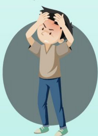
Intranquilidad o irritabilidad

Si tiene estos síntomas, debe acudir de inmediato a la unidad de salud mas cercana.