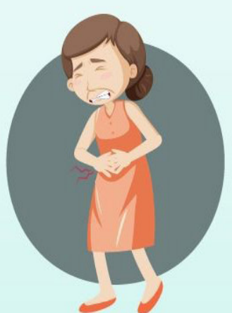
Dolor abdominal intenso

Cuando la fiebre baja, debe vigilar si en las próximas horas aparecen cualquiera de los siguientes síntomas: